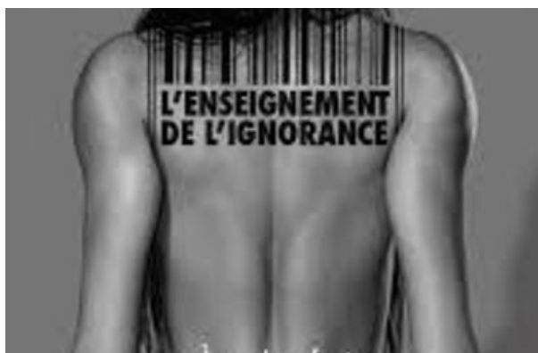
L'enseignement de l'ignorance

Published by www.vivantmag.fr - dans Spectacle Tout public commenter cet article