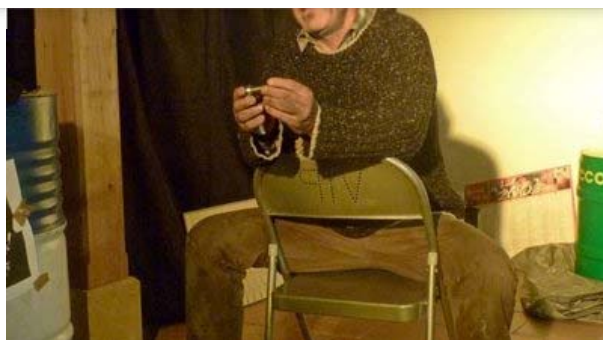
Miles Davis ou le coucou de Montreux